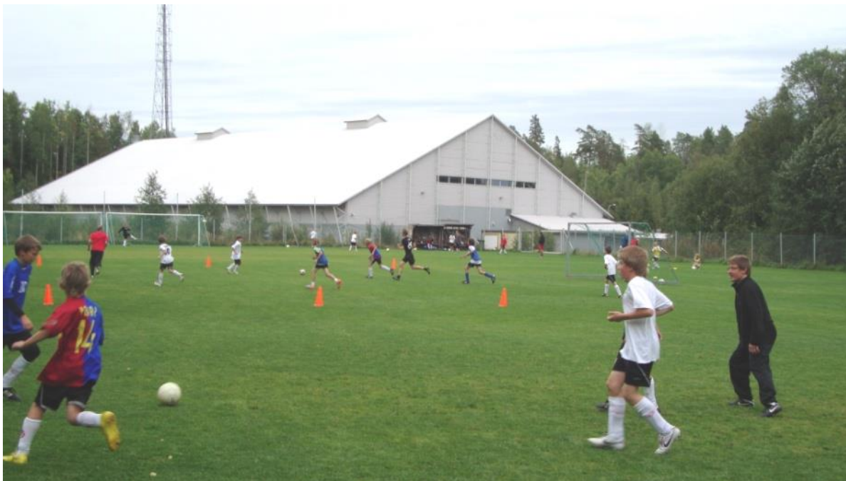
Espoon jalkapallohalli, jonka tontilla on myös Tuki Oy:n omistama luonnonnurmikenttä.

Olin vuosina 1989 – 2004 Espoon Jalkapalloilun Tuki Oy:n toimitusjohtaja. Vuonna 1996 rakennutimme yhteistyössä kuuden espoolaisseuran (FC Espoo, EPS, EsPa, Kasiysi, Hoogee, Tikka) Kauklahten Myntinsyrjään Suomen ensimmäisen yksityisen jalkapallohallin. Hallin kustannukset olivat 7.2 miljoonaa markkaa. Sen rahoituksesta hoidettiin 20 % omalla pääomalla ja 80 % kaupungin takaamalla lainalla. Oma pääoma kerättiin myymällä seuroille osakkeita, jotka antoivat kukin oikeuden yhden tunnin vuokratukseen jalkapallohallista.