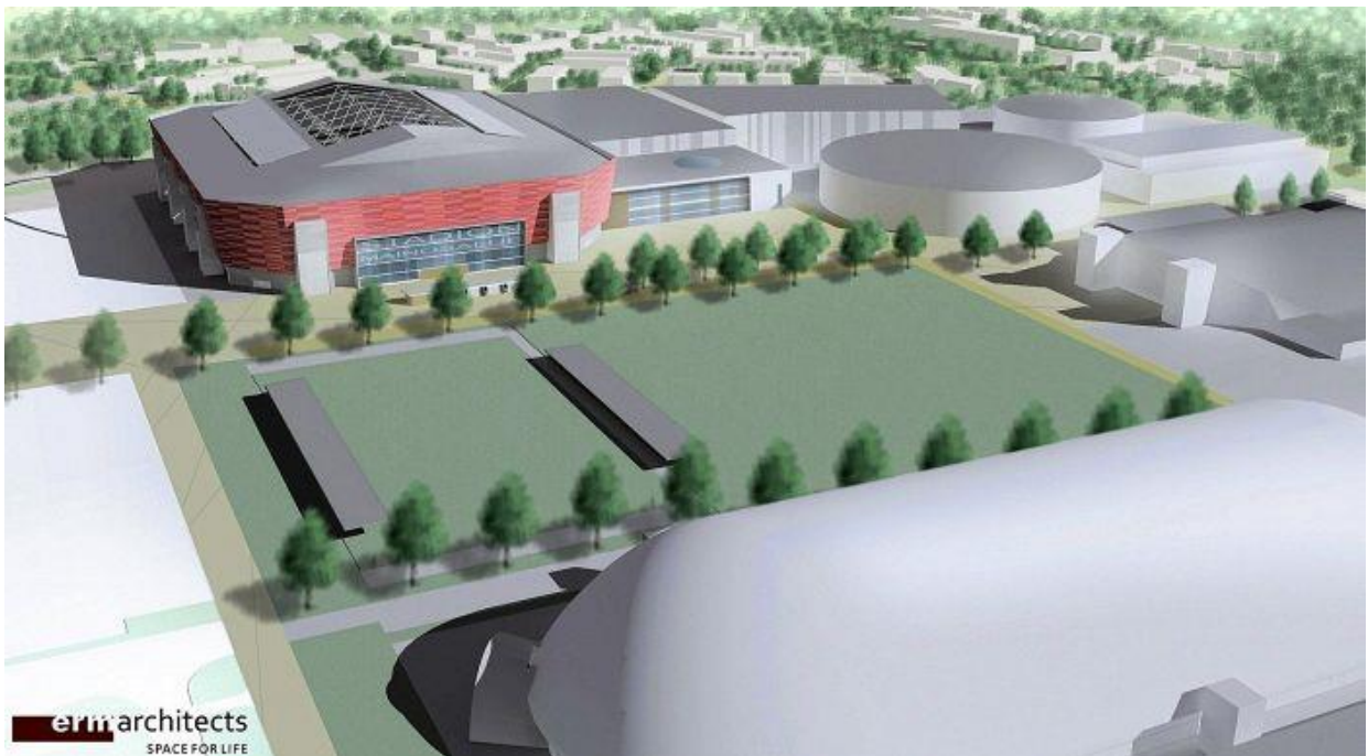
Tapiolan jalkapallostadion 2015