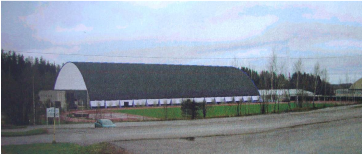
Havainnekuva Laaksoalahden jalkapallohallista (arkkit. Tuomas Vuorinen).

Kun huomasimme, että mitään apua ei kaupungilta jalkapallostadionia varten saataisi ja kaupunki suhtautui kielteisesti Leppävaaran stadionhankkeeseen, aloitimme kehittää Laaksoalahden jalkapallohallia siinä olevan sortuneen kuplahallin paikalle. Teimme siitä valmiit suunnitelmat ja esitimme tammikuussa 2001 kaupungille, että olemme valmiit rakentamaan 24,5 miljoonaa markkaa maksavan täysimittaisen (64 x 100 m) jalkapallohallin samalla yksityisellä periaatteella, kuten olimme tehneet Espoon jalkapallohallin 1996.