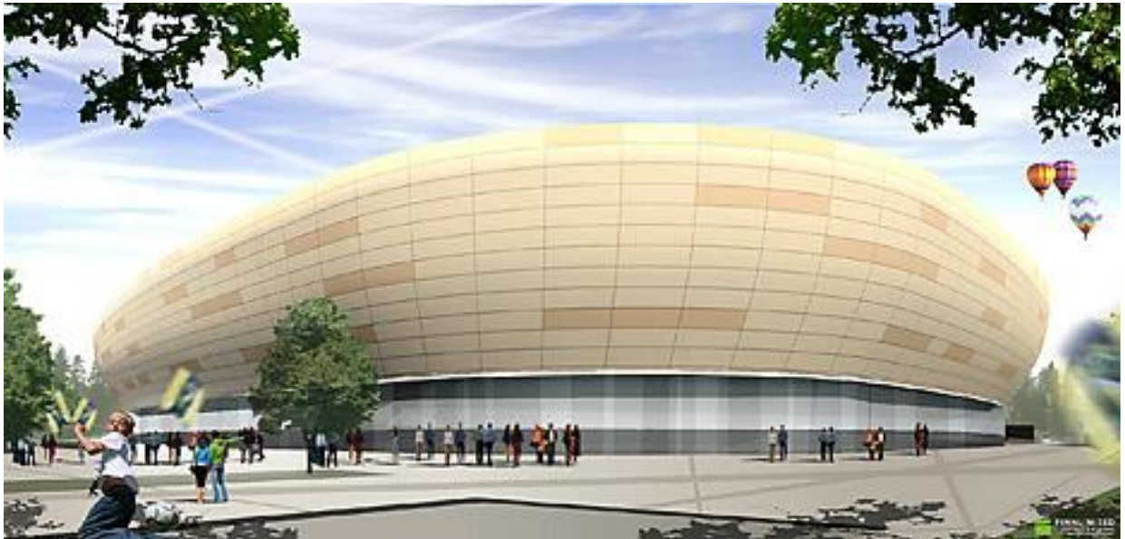
Tapiolan jalkapallostadion 2011